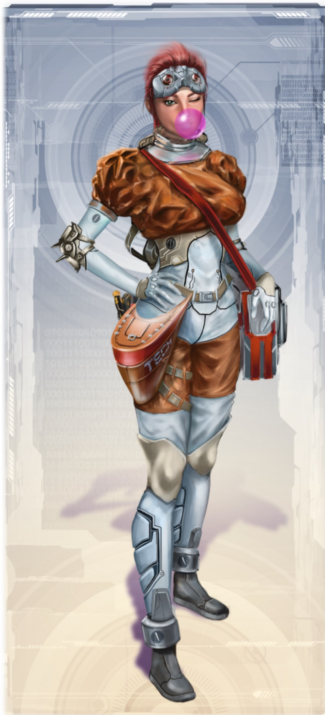
Иллюстрация: Игорь Есаулов